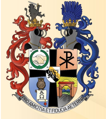
Wappen der AV Austria-Sagitta

Die Besonderheit – eine Studentenverbindung für christliche männliche Studenten zu sein – ist Bestandteil unserer Gründung. Im Geiste des zweiten Vatikanums wurden evangelische Bundesbrüder bei e.s.v. KÖStV Aus-