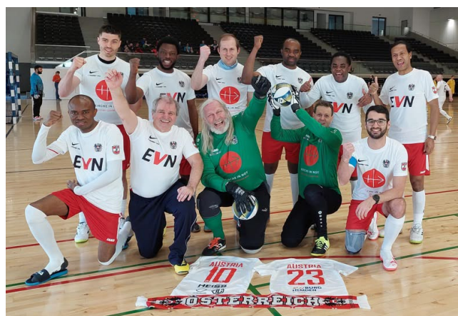
Die österreichische Nationalmannschaft